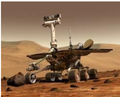
Bilde: Opportunity. NASA

Det ble fort klart at det ikke bor små grønne menn på Mars, men letingen på spor etter tidligere liv, og kanskje mikrobisk liv, fortsetter. Forskerne har bekreftet at det en gang må ha vært vann og elver på Mars, og det antas at det kanskje finnes vann et stykke under overflaten. Det har også blitt bekreftet at det finnes is ved polområdene. Dette øker spenningen og troen på at det kan være spor etter organismer der hvor det finnes vann.